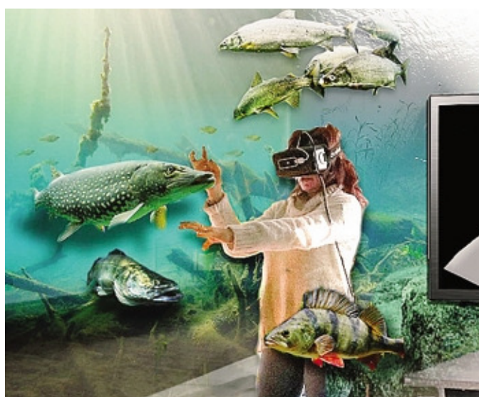
Uno degli ambienti del museo virtuale

Geno (dove ha sede l'associazione Proteus ed è già presente un salone didattico) in un museo dove, grazie a un'installazione per realtà virtuale, si riuscirebbe a trasportare cittadini e turisti negli ambienti più caratterizzanti del nostro territorio: l'aspetto sommerso del lago. «L'ambientazione sarebbe scansionata in ambiente subacqueo per garantire un'esperienza di assoluto realismo e massi-