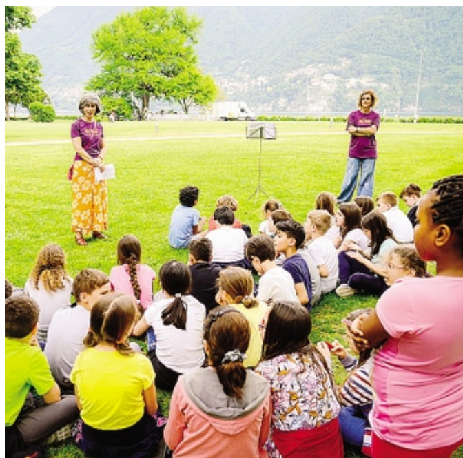
Una delle iniziative per i bambini lo scorso anno a Villa Erba

«Il Festival del futuro sostenibile - sottolinea il presidente di Acsm-Agam Giovanni Orsenigo - affronta temi di grande, incalzante attualità in linea con le politiche adottate dalle aziende del nostro gruppo».